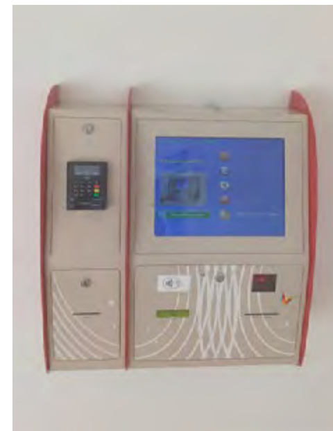
La borne de recharge