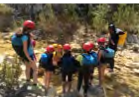
Encadrement de public support lors de la formation

Formation, haut niveau, développement du sport, jeunesse et éducation populaire, les domaines d'intervention du CREPS Auvergne-Rhône-Alpes Vallon-Pont-d'Arc · Voiron · Lyon sont multiples et s'adressent à l'ensemble des sportifs et des acteurs du sport.