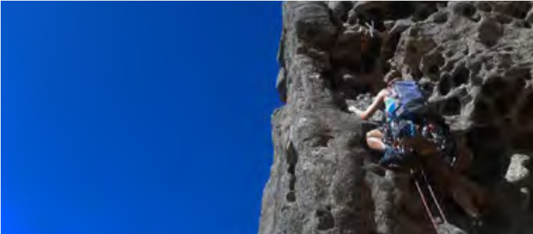
DEJEPS Escalade en Milieux Naturels