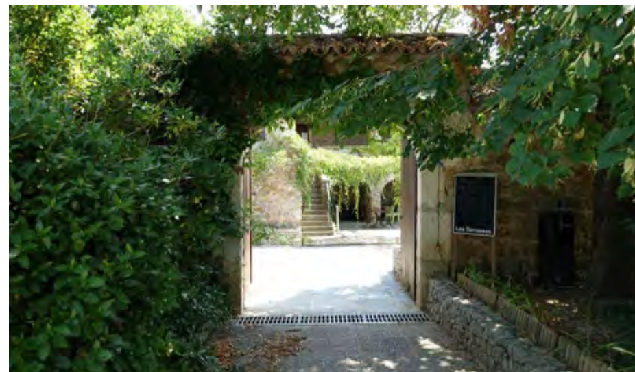
Entrée du foyer, appelé "MAS"

Cet espace partagé doit être laissé dans l'état où il a été trouvé.