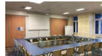
Salle Lecler bis