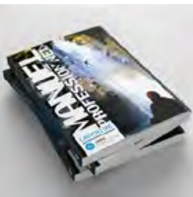
Manuel Professionnel de Canyonisme réalisé en partenariat avec la fondation PETZL en 2018