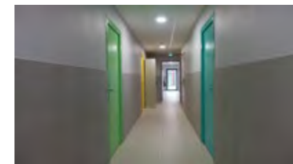
Couloir intérieur bâtiment Tanargue