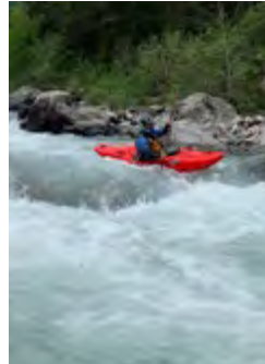
DEJEPS Canoë-Kayak et disciplines associées en eau vive

Une individualisation et une personnalisation de la formation est assurée au regard de la diversité des publics accueillis :