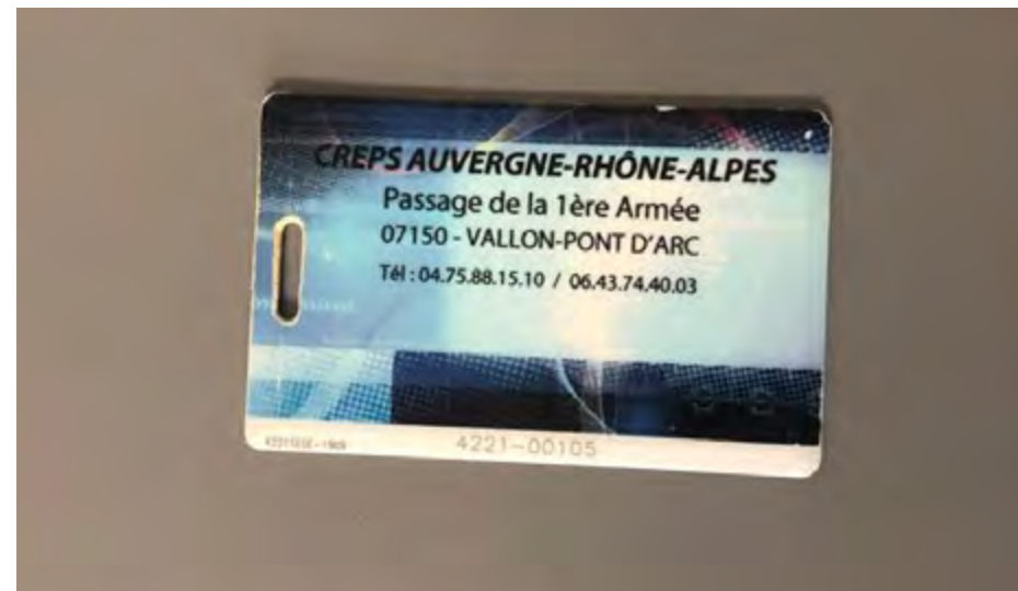
La carte turboself

Le règlement sera effectué à réception de la facture mensuelle qui vous sera adressée par courriel.