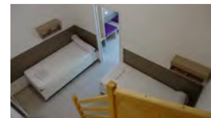
Chambre collective bâtiment Tanargue