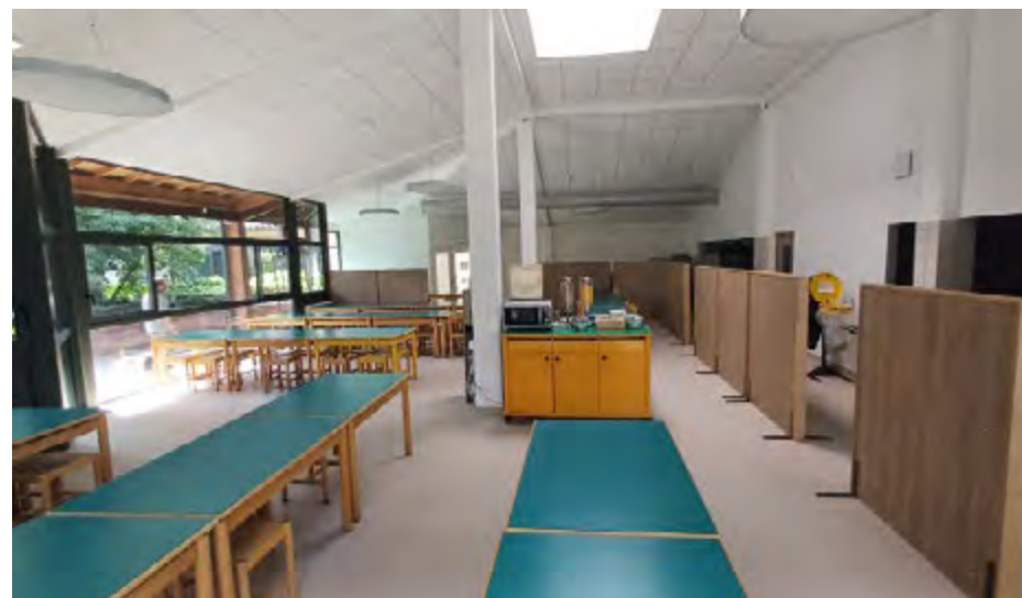
Restaurant du CREPS