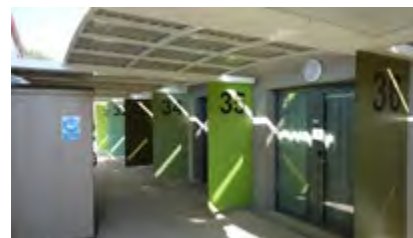
Couloir extérieur bâtiment Gournier