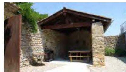
Extérieur, espace couvert