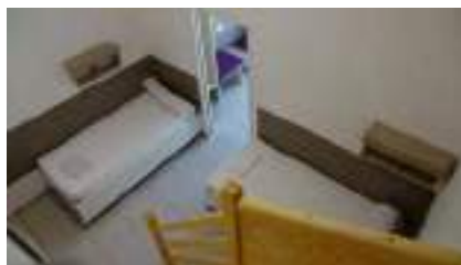
Chambre collective bâtiment Tanargue