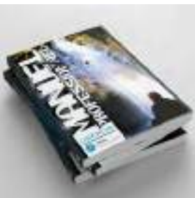
Manuel Professionnel de Canyonisme réalisé en partenariat avec la fondation PETZL en 2018