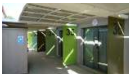
Couloir extérieur bâtiment Gournier