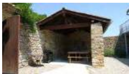
Extérieur, espace couvert