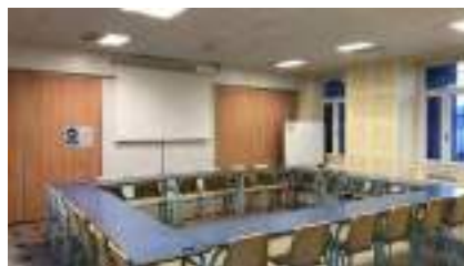
Salle Lecler bis