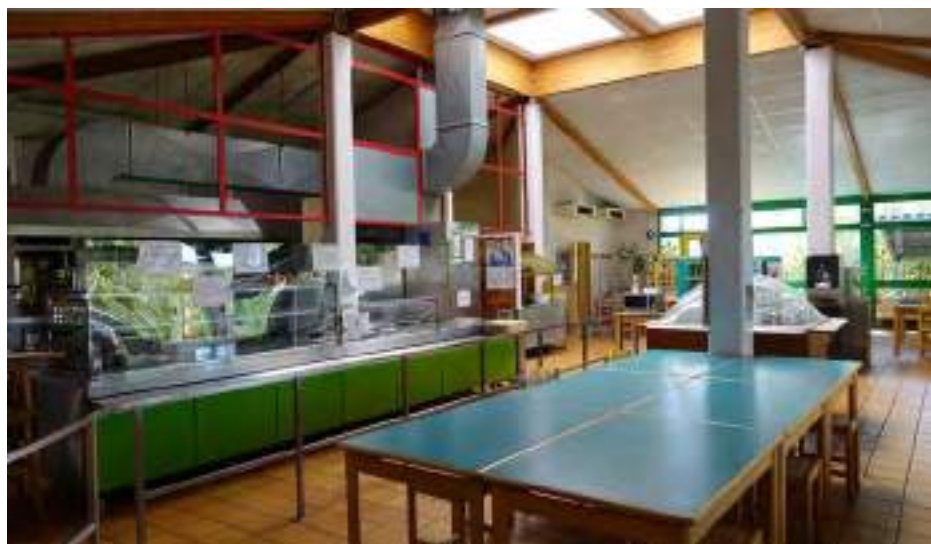
Restaurant du CREPS