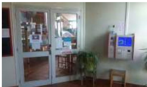
La borne de recharge