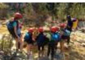
Encadrement de public support lors de la formation

Formation, haut niveau, développement du sport, jeunesse et éducation populaire, les domaines d'intervention du CREPS Auvergne-Rhône-Alpes Vallon-Pont-d'Arc - Voiron - Lyon sont multiples et s'adressent à l'ensemble des sportifs et des acteurs du sport.