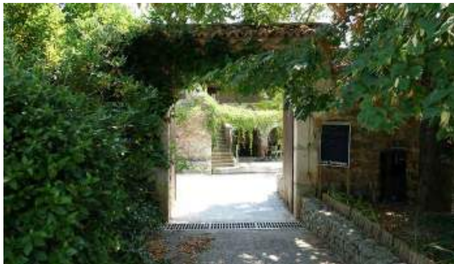
Entrée du foyer, appelé "MAS"