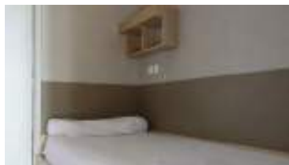
Chambre individuelle bâtiment Gournier