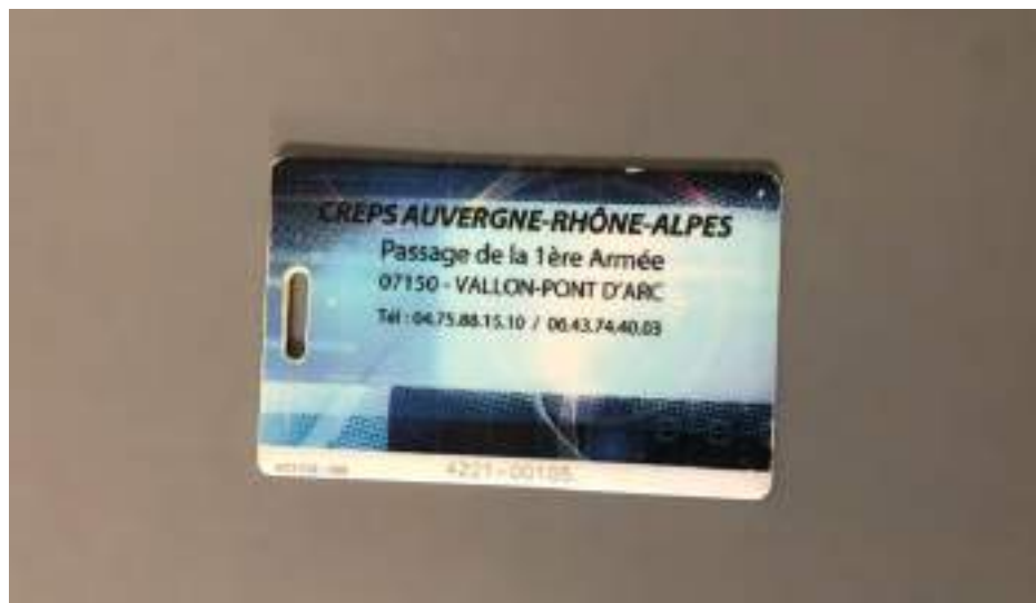
La carte turboself