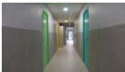
Couloir intérieur bâtiment Tanargue